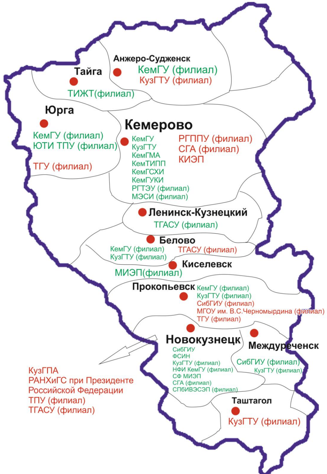
Рис. 1. Карта-схема распределения образовательных организаций высшего образования в Кемеровской области

образования на территории Кемеровской области с семью организациями федерального подчинения и двумя-тремя сильными филиалами.