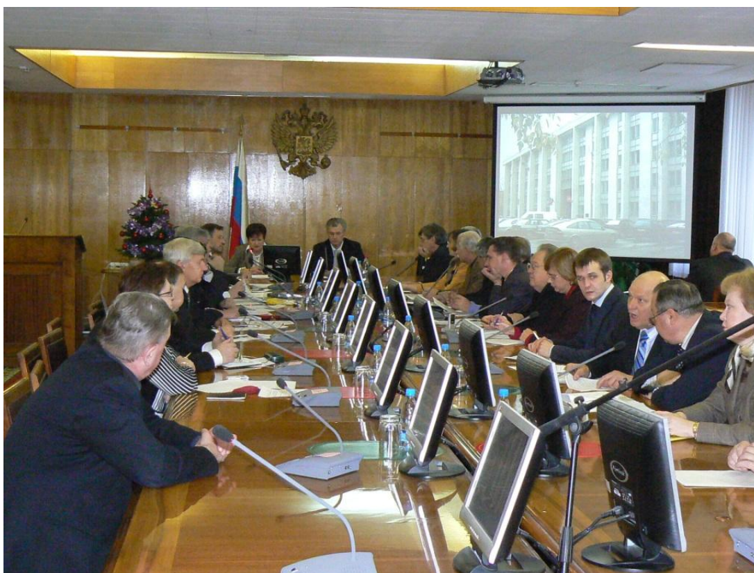
Рабочая встреча в Федеральном агентстве по образованию, 2008 год