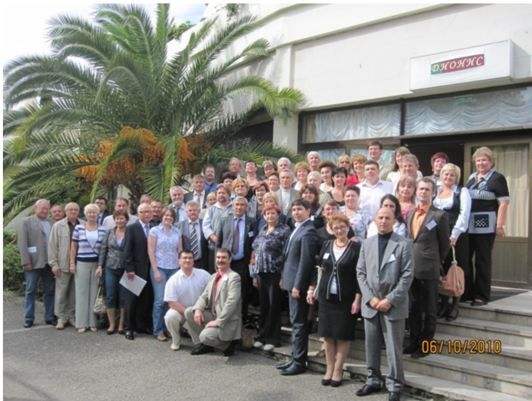
Участники V Всероссийского семинара-совещания, организаторами которого выступили Министерство образования и науки Российской Федерации и Общероссийский Профсоюз образования

В работе семинара-совещания приняли участие 92 человека, представляющие 43 субъекта Российской Федерации.