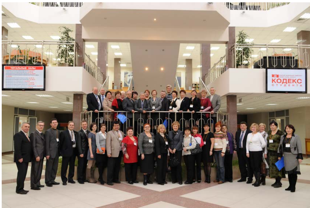
Общая фотография в библиотеке ФГАОУ "Сибирский федеральный университет".